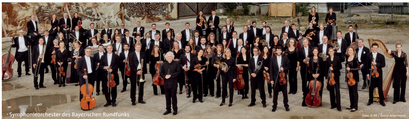
Symphonieorchester des Bayerischen Rundfunks