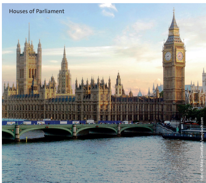
Houses of Parliament

Falls Sie auch heute schon das Symphonieorchester des Bayerischen Rundfunks in der Royal Albert Hall hören möchten, besorgen wir Ihnen gerne Karten. Gespielt wird unter der Leitung von Sir Simon Rattle T. Ades: Aquifer und A. Bruckner: Symphonie Nr. 4.