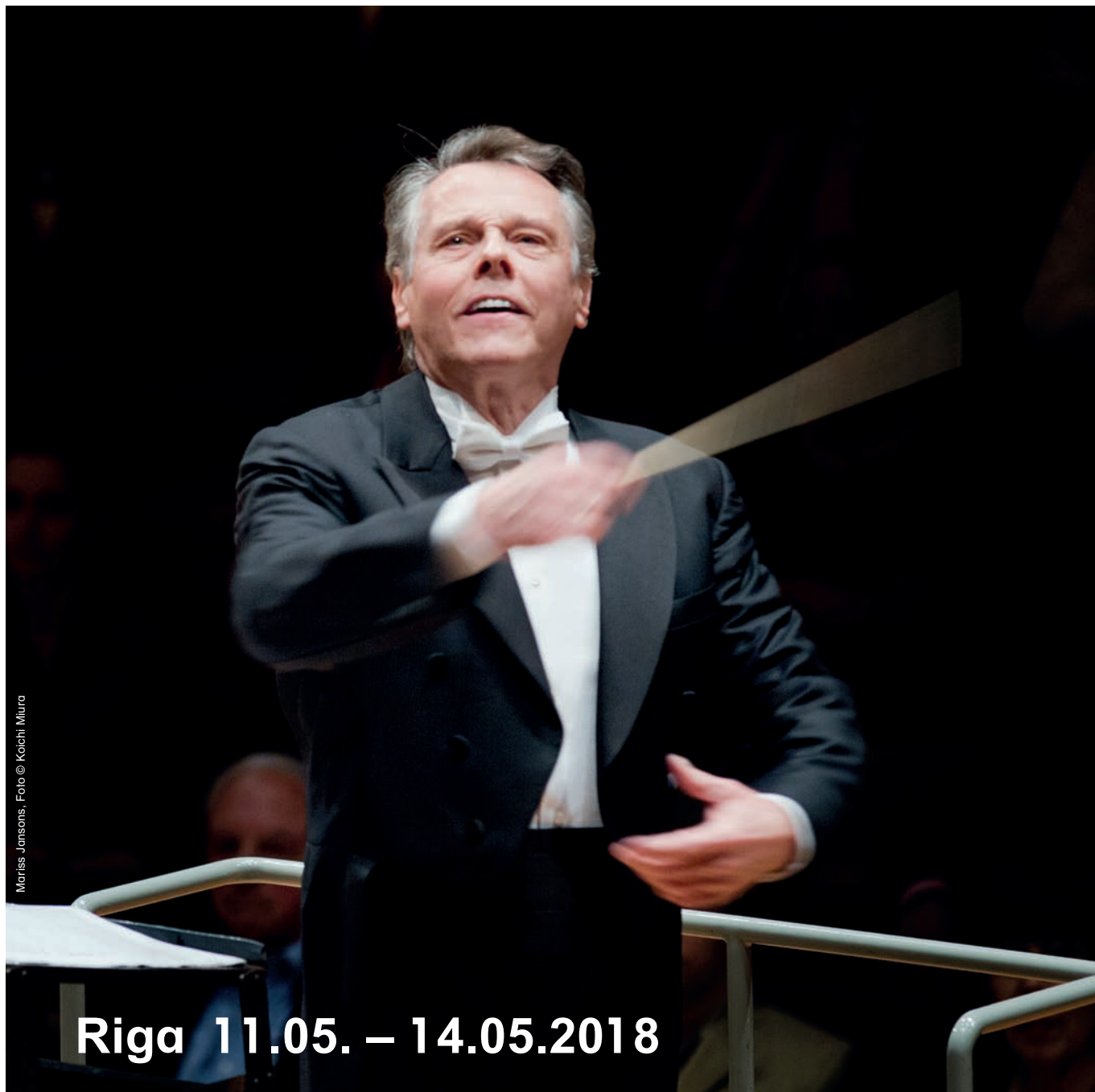
Mariss Jansons

Erleben Sie das Symphonieorchester des Bayerischen Rundfunks und Mariss Jansons bei einem Gastkonzert in Riga