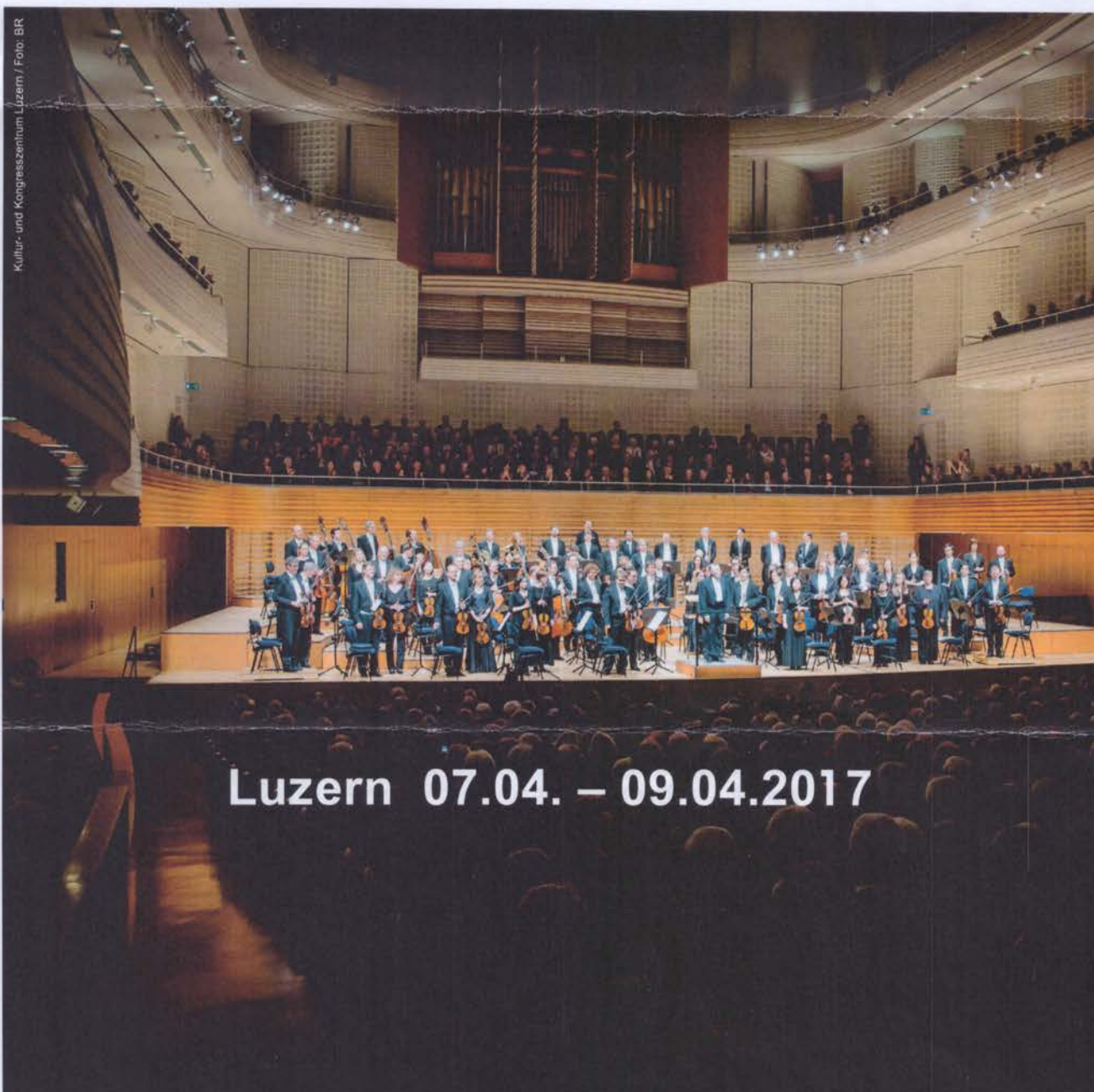
Kultur- und Kongresszentrum Luzern

Erleben Sie beim Oster-Festival in Luzern das Symphonieorchester und den Chor des Bayerischen Rundfunks