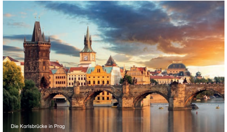
Die Karlsbrücke in Prag