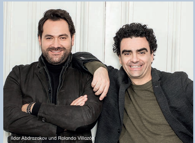
Ildar Abdrazakov und Rolando Villazón