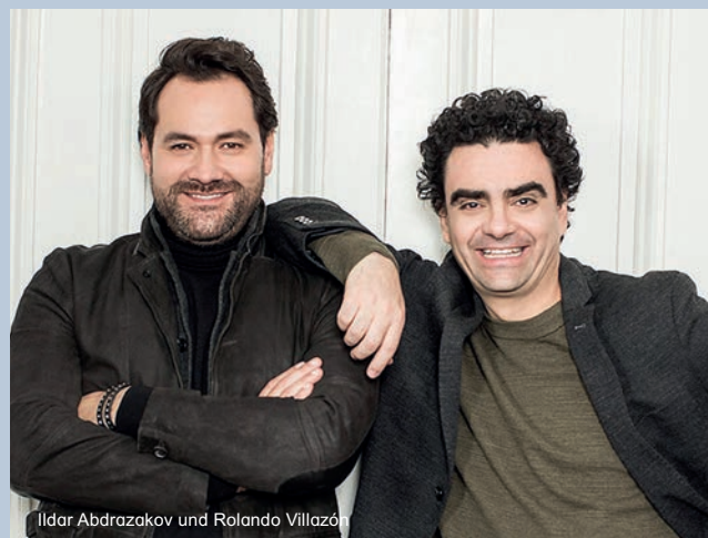
Ildar Abdrazakov und Rolando Villazón