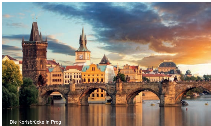
Die Karlsbrücke in Prag