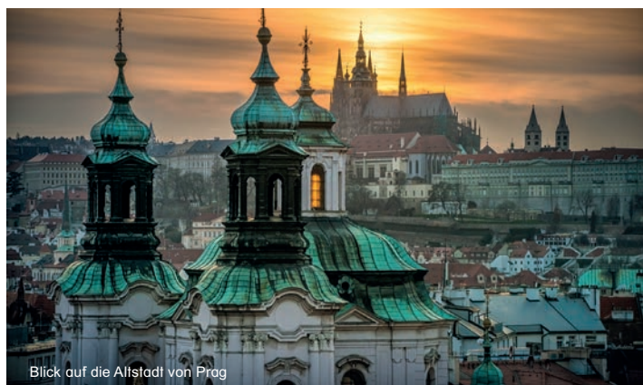
Blick auf die Altstadt von Prag