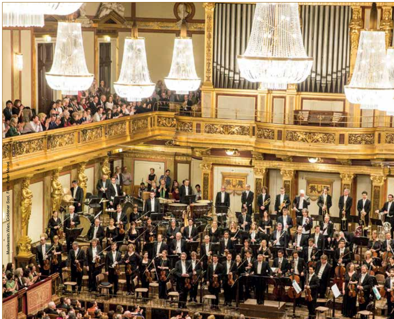
Musikverein Wien, Goldener Saal

Erleben Sie Mariss Jansons und das Symphonieorchester des Bayerischen Rundfunks bei internationalen Gastkonzerten 2017 und 2018